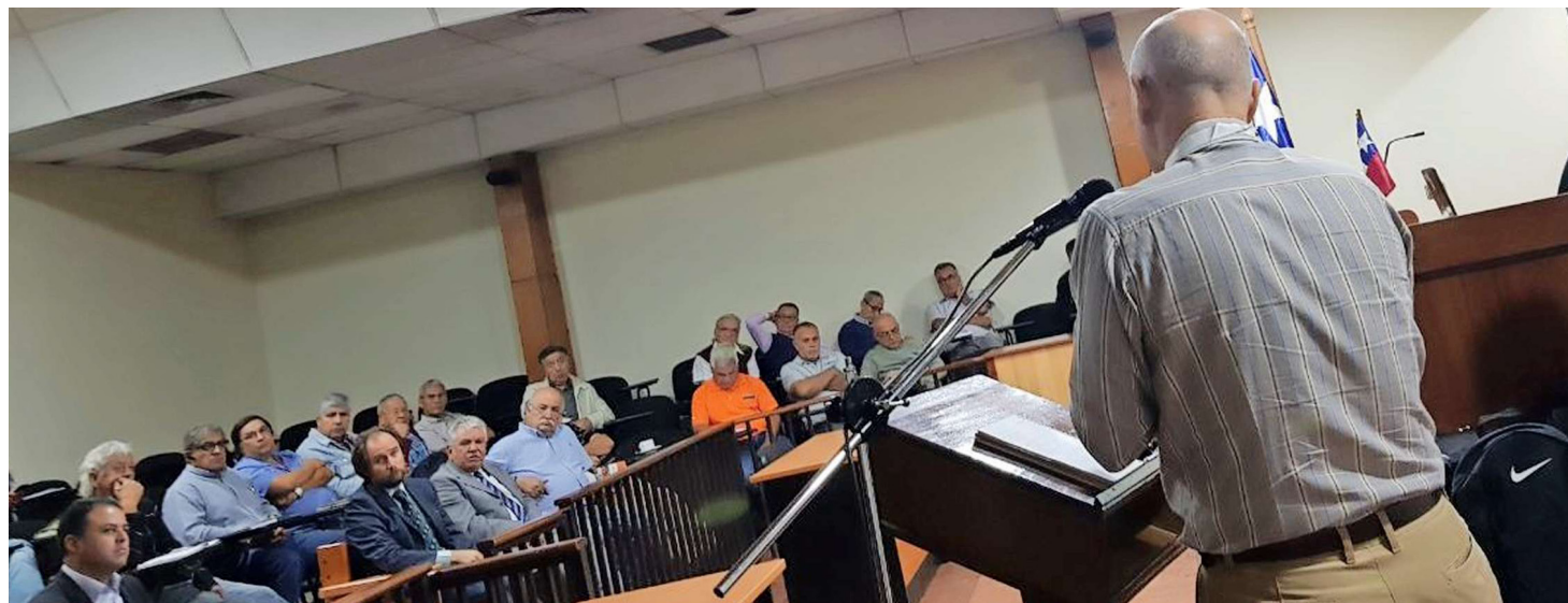
En asamblea realizada en la UBO, los taxistas pudieron conocer más detalles de cómo Taxicity aporta a mejorar su actividad.